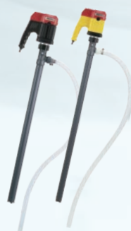
ケミカル ハンディポンプ