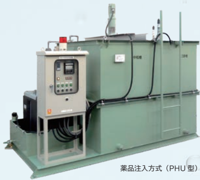
薬品注入方式 (PHU 型)