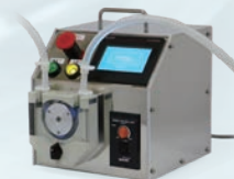
ポータブル式充填機 (CTH-i)