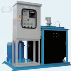
高耐食性薬液注入方式 (PHE 型)