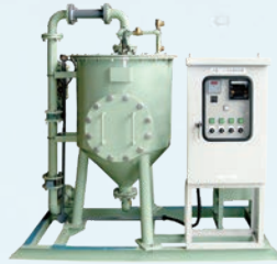
炭酸ガス注入方式 (PHG 型)