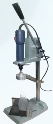
卓上型手動式キャッパー (PCS)