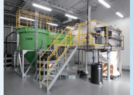
凝集沈殿処理装置 加圧浮上処理装置 各種廃水処理装置