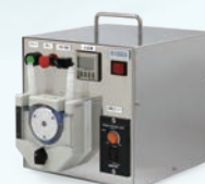
ポータブル式充填機 (CTH)